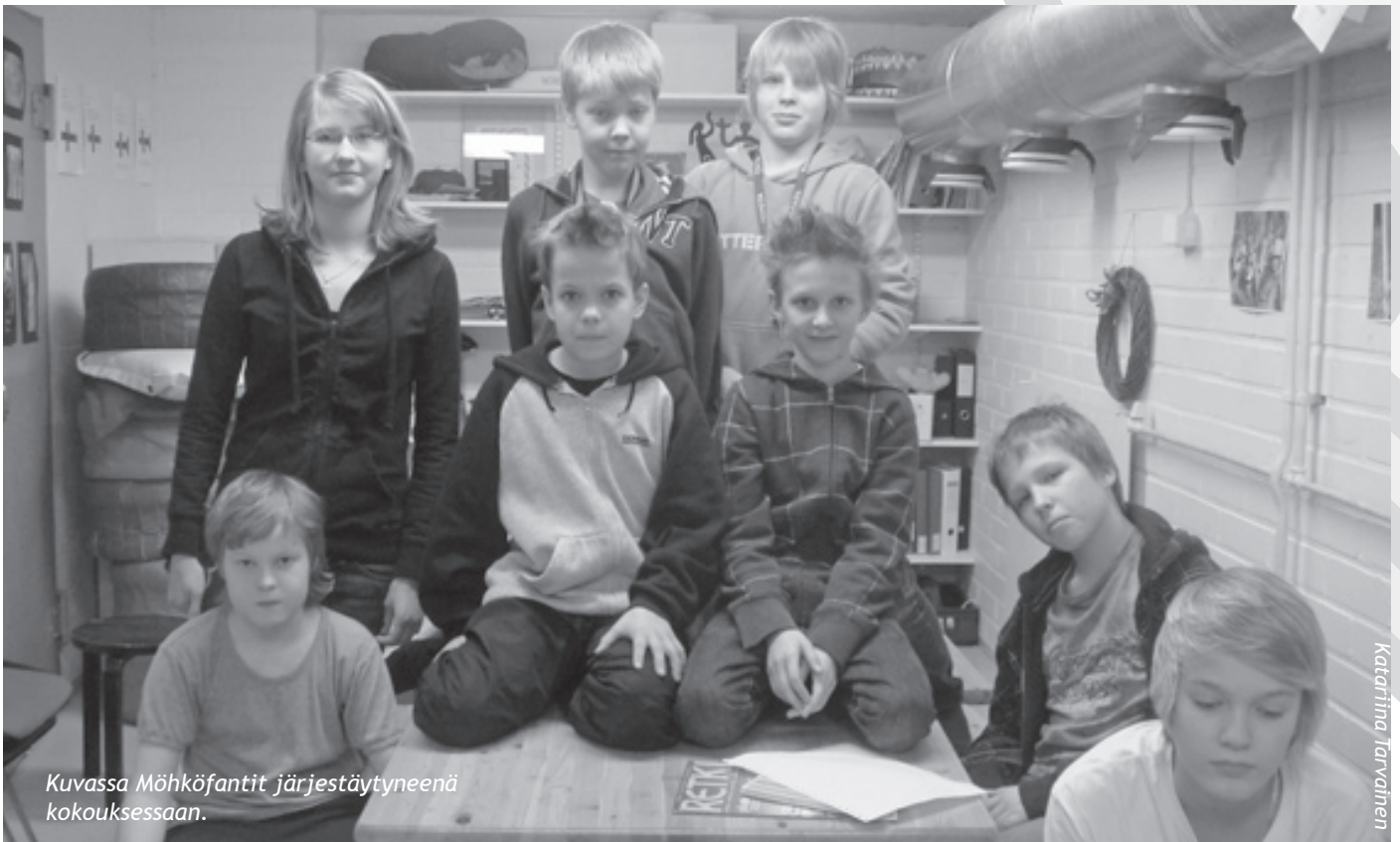
Kuvassa Möhköfantit järjestäytyneenä kokouksessaan.

Nyt kun lunta on maassa, aiomme mennä pulkkailmeen ja ehkä vielä luistelemaankin. Möhköfantit jatkavat tavalliseen tapaan kokouksiaan ja toivottavat kaikille muille kaskipartiolaisille hauskaa kevättä!