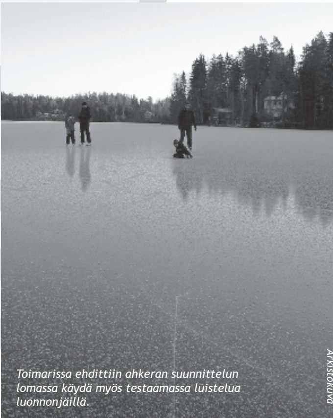
Toimarissa ehdittiin ahkeran suunnittelun lomassa käydä myös testaamassa luistelua luonnonjäällä.

Enempää ei ”vanhoista parroista” saa tanssilattiasta irti, mutta siinä olikin varmaan olennaisiin. Harmi kyllä, vanhat kämppäkirjat tuhoutuivat viimeisimmässä vesivahingossa Uimalan lainehtiessä, muuten olisi voinut tuon ”Tanssikengät”-redun sieltä etsiä. Mutta, kun seuraavan kerran menet kämpälle, ei muuta kuin ”sileäpohjaiset Don Röhköt” jalkaan, nyt tiedät missä on tanssilattia!